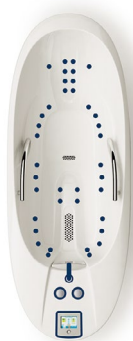
DELTA 30 Deluxe