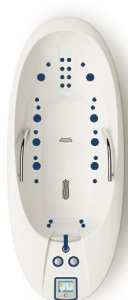
ALFA 40 Deluxe