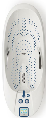
Omega 30 Deluxe