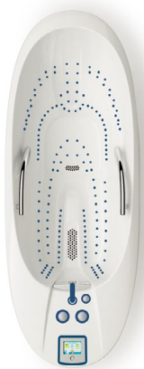
Omega 20 Deluxe