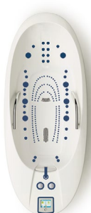
ALFA 70 Deluxe