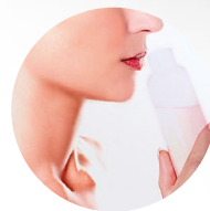
Ароматерапия и добавки для ванн