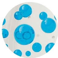
Насыщение воды углекислым газом