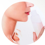
Ароматерапия и добавки для ванн