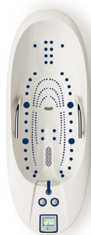
DELTA 50 Deluxe