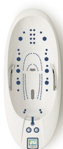
ALFA 60 Deluxe