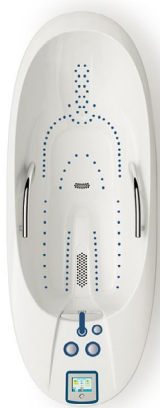
Omega 10 Deluxe