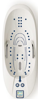
DELTA 40 Deluxe