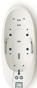
ALFA 30 Deluxe